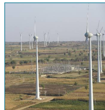
Parque de Gadag