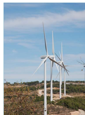
Parque Mudefer II