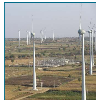
Parque de Gadag