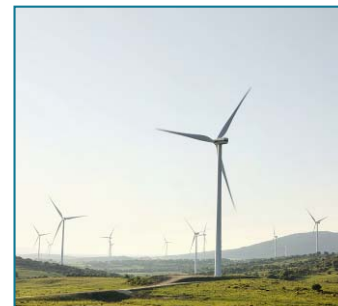
Pedregoso y Pino