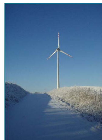
Fase I Kisielice