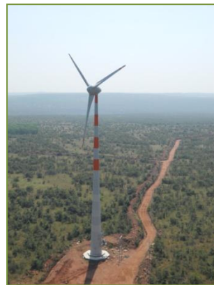
Parque de Hanumantatti