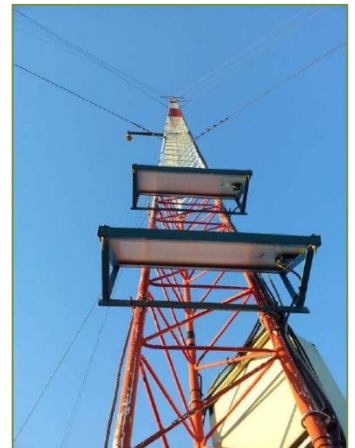
Torre de medición en Montenegro