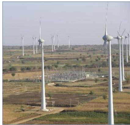
Parque de Gadag