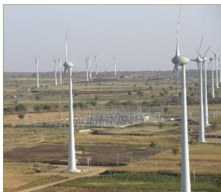
Parque de Gadag