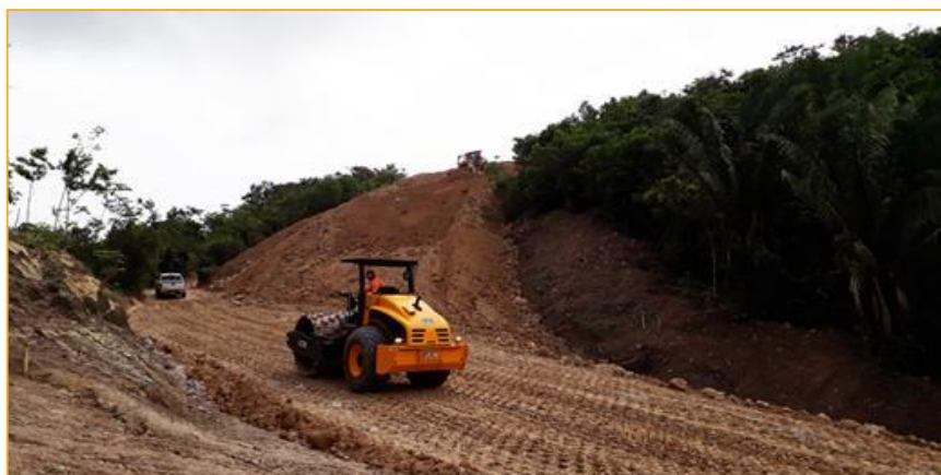
Obras de construcción en Panamá