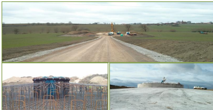
Trabajos de construcción de Postolin