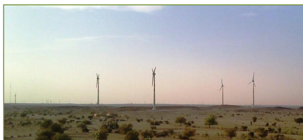
Parque de Bhakrani