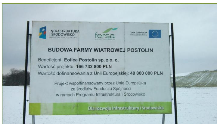
Inicio de construcción de Postolin (Polonia)