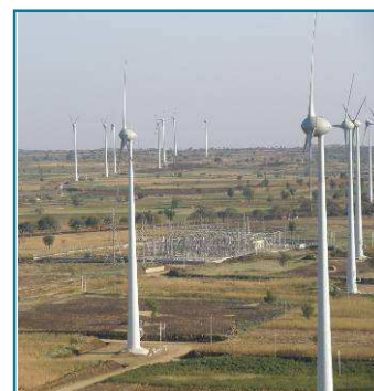
Parque de Gadag